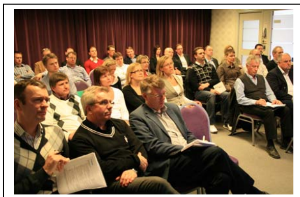
Seminarieriet lockade ett 50-tal deltagare

Varje år bjuder BEAst in till ett öppet seminarium i anslutning till årsstämman. I år deltog ett 50-tal personer som kunde lyssna på en blandning av praktikfall och projektredovisning.