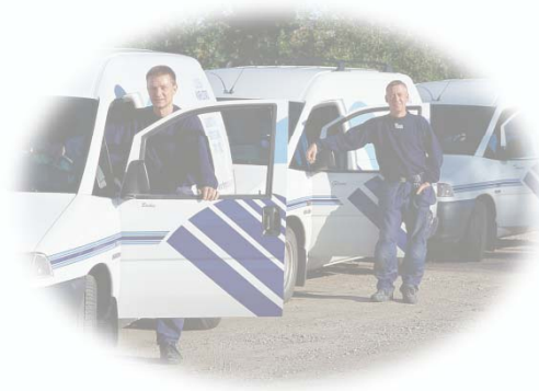
Tjänster & Efterservice