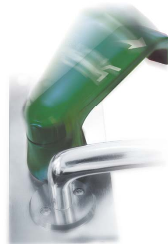
Dörrmiljö, Lås & Säkerhet