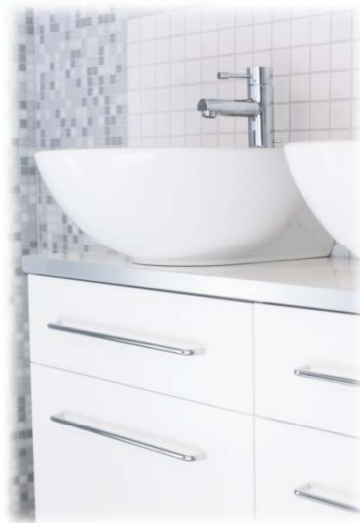
Beslag & Inredning